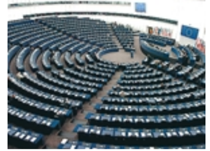
Vet du var EU-parlamentet sammanträder när det fattar beslut?