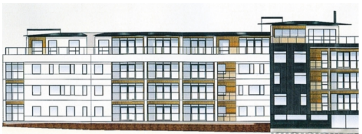
Så här är det tänkt att det nya huset på W-frös gamla tomt ska se ut.